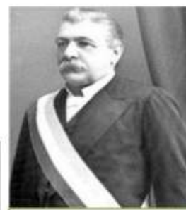
Domingo Santa María González (1881-1886)