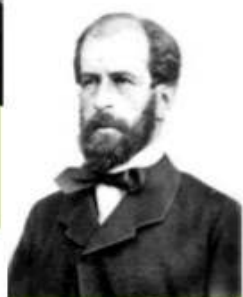
Federico Errázuriz Zañartu ( 1871-1876)