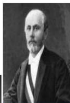
Anibal Pinto Garmendia (1876-1881)