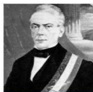
José Joaquín Pérez Mascayano (1861- 1871)