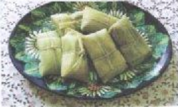
Humitas, comida tradicional chilena.