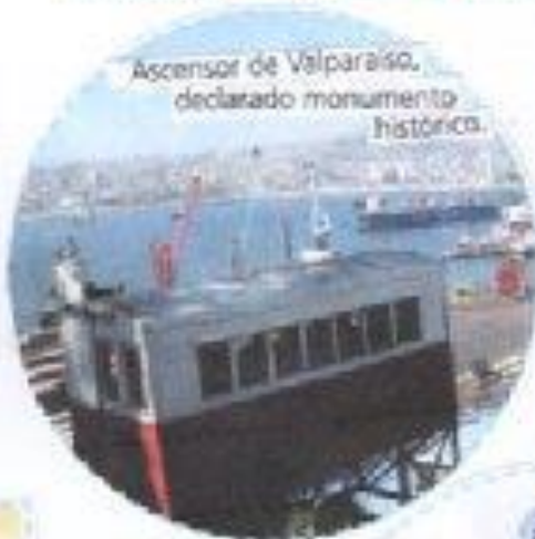
Ascensor de Valparaíso, declarado monumento histórico.