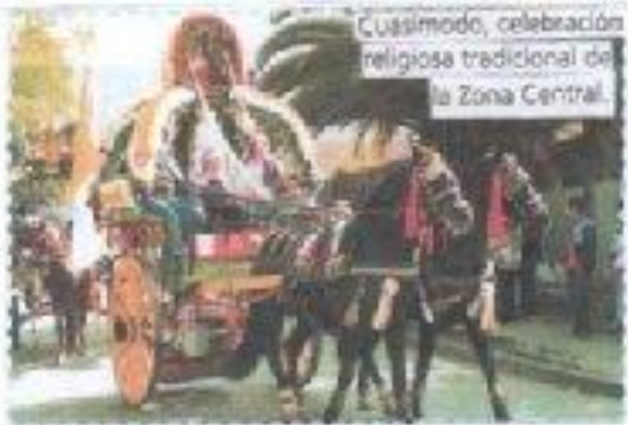
Cusimodo, celebración religiosa tradicional de la Zona Central.