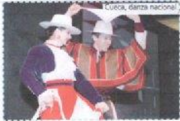
Cueca, danza nacional.