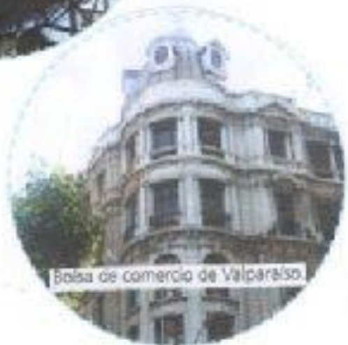
Bolsa de comercio de Valparaíso.