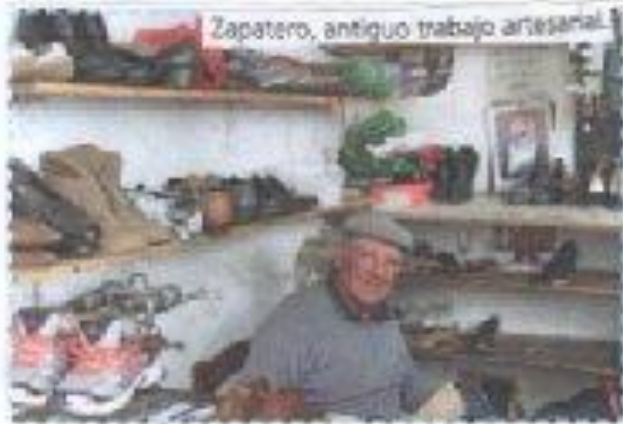
Zapatero, antiguo trabajo artesanal.