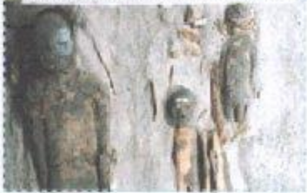
Momias chinchorio encontrada en la Zona Norte.