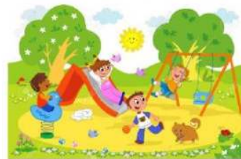
JUGAR EN EL PARQUE