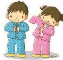
PONERSE LA PIJAMA